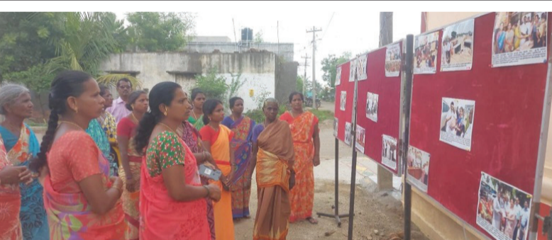
காஞ்சிபுரம் மாவட்டம் செய்தி மக்கள் தொடர்பு அலுவலகத்தின் சார்பில் குன்றத்தூர் ஊராட்சி ஒன்றியம் அமரப்பேடு ஊராட்சியில் தமிழ்நாடு அரசின் திட்டங்கள் மற்றும் சாதனைகள் குறித்து அமைக்கப்பட்ட புகைப்பட கண்காட்சியை பொதுமக்கள் பார்வையிட்டனர்.

சென்னை, நவ.6-இந்தியாவில் தனியார் துறையில் 6வது மிகப்பெரிய வங்கியான யெஸ் பேங்க், மறுசீரமைப்பிற்கு பிறகு காலாண்டுகளில் மிக உயர்ந்த லாபத்தை எட்டியிருக்கிறது. முந்தைய ஆண்டுடன் ஒப்பிடுகையில், 145.6% வளர்ச்சியையும் மற்றும் முந்தைய காலாண்டுடன் ஒப்பிடுகையில் 10.1% வளர்ச்சியையும் கண்டுள்ளது. மிக உயர்ந்த காலாண்டு லாபம் ரூ.552 கோடி என்ற அடிப்படையில் 145.6% வளர்ச்சி விகிதம், முந்தைய ஆண்டுடன் ஒப்பிடுகையில், 2.6% புள்ளிகள் முன்னேற்றத்துடன் 32% எட்டியிருக்கிறது. நடுத்தர நிறுவனங்களுக்கு வழங்கப்பட்ட கடன்கள் முறையே 25.8% மற்றும் 25.5% வளர்ச்சி கண்டிருக்கின்றன. (மொத்த வாராக்கடன்) விகிதமானது, 1.6% குறைந்திருக்கிறது. நிகர வாராக்கடன் 0.5% என்ற அளவில் பதிவாகியிருக்கிறது. முந்தைய ஆண்டுடன் ஒப்பிடுகையில், மொத்த டெபாசிட்கள் 18.3% உயர்ந்திருக்கின்றன. சிறு, நடுத்தர தொழில் நிறுவனங்கள் மற்றும் இடைநிலை கார்ப்பரேட் நிறுவனங்கள் நியமனம் மீது இவ்வங்கி சிறப்பு கவனம் செய்யப்பட்டிருக்கின்றன.